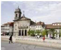
16 IGREJA S. PEDRO

A Igreja de S. Pedro foi a primeira igreja na Arquidiocese de Braga a receber o título de basílica, graças ao indulto concedido pelo Breve de Benedito XIV em 1751. A igreja, de formas simples, que acolhe a imagem do padroeiro, começou a ser construída em 1737 e posteriormente benzida, em 1750. Em 1881, reiniciam-se as obras com a demolição das estruturas provisórias e das casas em frente ao corpo da igreja. Os trabalhos terminariam nos inícios do séc. XX, sendo apenas construída uma das duas torres previstas. A igreja, de planta longitudinal, possui capela-mor e nave única retangulares. A capela-mor é separada da nave por arco de cruzeiro de volta perfeita e nela se destaca um retábulo de talha azul e dourada.