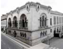
17 MUSEU ARQUEOLÓGICO DA SOCIEDADE MARTINS SARMENTO

A Sociedade Martins Sarmiento é uma instituição cultural de natureza privada, sem fins lucrativos, que foi fundada em 1881 em homenagem ao arqueólogo vimaranense Francisco Martins Sarmiento. A sua sede é um imponente edifício, em estilo neoclássico, projetado pelo arquiteto Marques da Silva, onde estão instalados o mais antigo Museu Arqueológico português e uma magnífica Biblioteca Pública dotada de uma notável secção de livros acerca de Guimarães. O Museu Arqueológico da Sociedade Martins Sarmiento, um dos espaços de referência da história da arqueologia em Portugal, foi fundado em 1885, e do seu acervo destacam-se materiais castrejos e romanos, fruto de escavações realizadas na região, especialmente das que tiveram lugar na Citânia de Briteiros. Desde 1888 que está instalado no